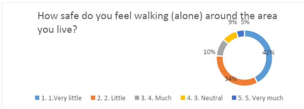
Figure 2 سروی وضعیت منازعه و خشونت توسط دفتر SFCG

طبق همین سروی حدود 10 درصد از پاسخ دهندگان گفته اند که کسی را از آشنایان شان می‌شناسند که توسط رژیم حاکم مورد پیگرد قرار گرفته اند 27 .